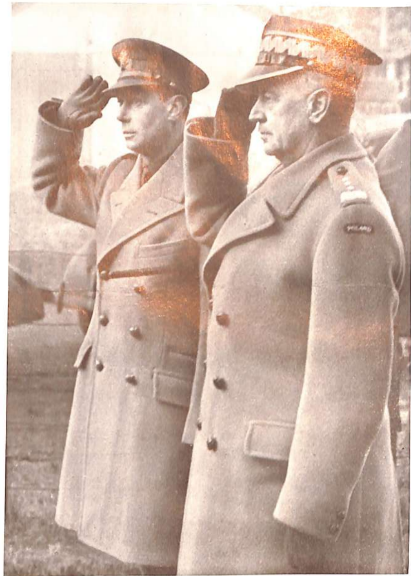
Jego Królewska Mość Jerzy VI oraz Wódz Naczelny Wojska Polskiego Generał Broni Władysław Sikorski.