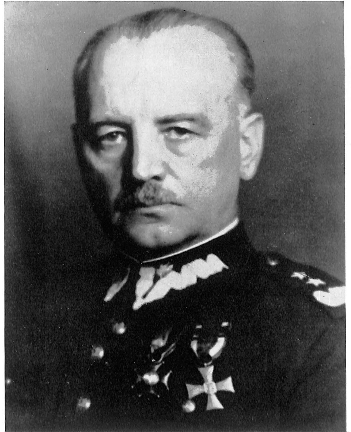
Władysław Raczkiewicz Prezydent Rzeczypospolitej President of the Republic of Poland